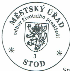
Straková Jarmila referentka odboru životního prostředí

Odvolání se podává s potřebným počtem stejnopisů tak, aby jeden stejnopis zůstal správnímu orgánu a aby každý účastník dostal jeden stejnopis. Nepodá-li účastník potřebný počet stejnopisů, vyhotoví je správní orgán na náklady účastníka. Odvoláním lze napadnout výrokovou část rozhodnutí, jednotlivý výrok nebo jeho vedlejší ustanovení. Odvolání jen proti odůvodnění rozhodnutí je nepřipustné.